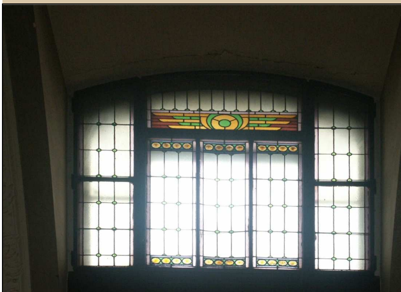
celkový pohled z interiéru