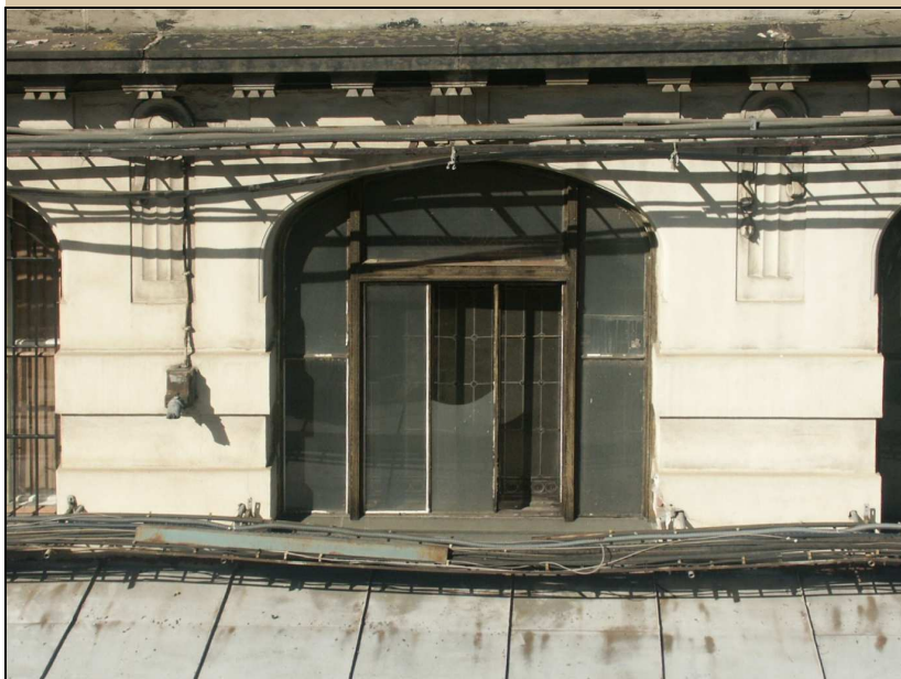
celkový pohled z exteriéru – východní průčelí