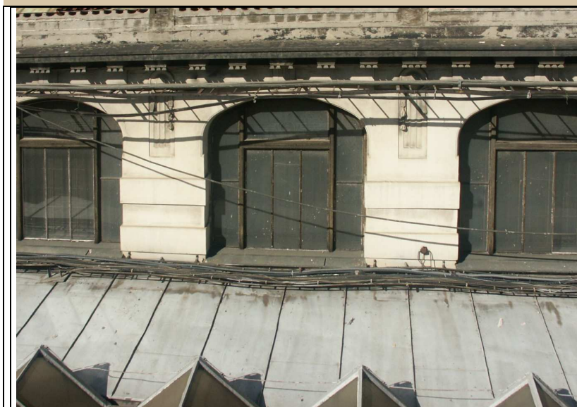
celkový pohled z exteriéru – východní průčelí