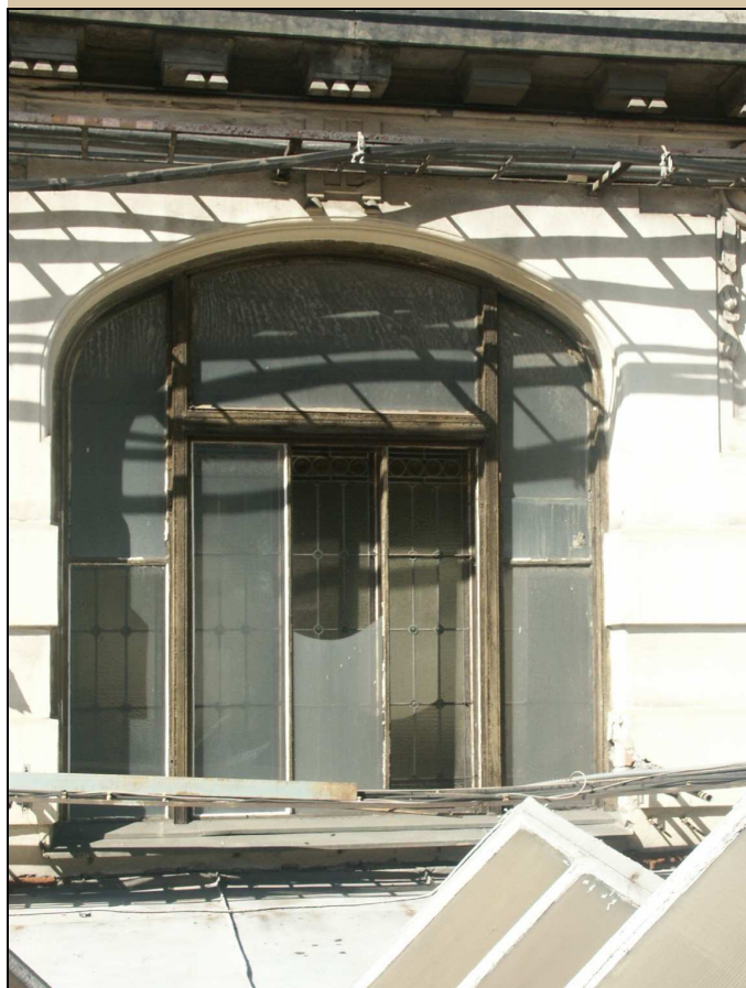
okno – celkový pohled z exteriéru – východní průčelí

Po dokončení opravy rámu nechat restaurátorem zkontrolovat vitráž.